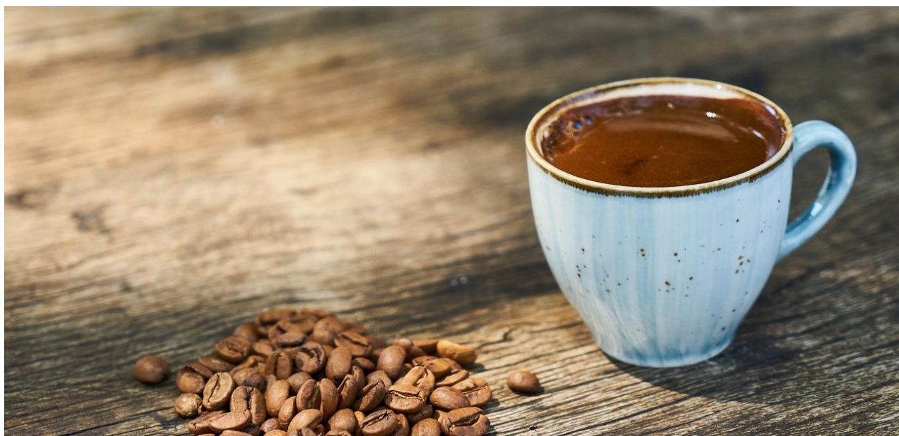
1 - Caffè Turco

* L'itinerario potrebbe subire variazioni per motivi tecnici o di gestione dei siti.