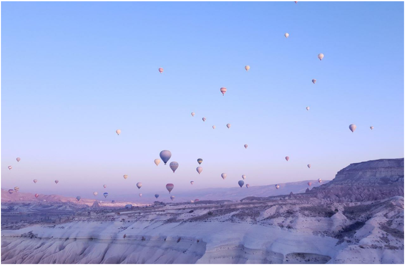
2 - Mongolfiere in Cappadocia